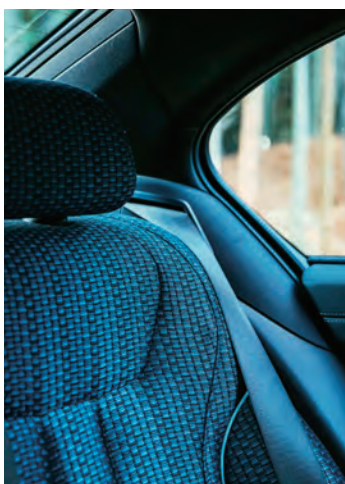
クラフトカーサービス提供する「Kiwakoto」の特別なシート。西陣織の特徴である「箔」という技法を用いたテキスタイルがシートに表情を与える